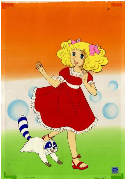
Yumiko Igarashi et Kyoko Miziuki – Candy Candy